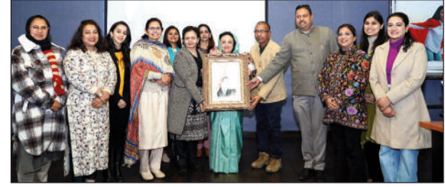
सिटी दर्पण चंडीगढ़

जीजीडीएसडी कॉलेज और युवसत्ता की संयुक्त पहल का लक्ष्य कॉलेज की 50 छात्राओं को सफल उद्यमी बनाने के लिए तैयार करना है