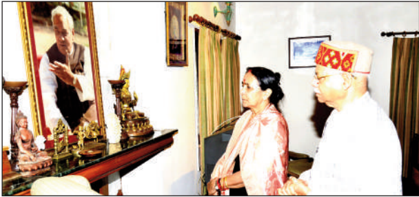
सिटी दर्पण शिमला