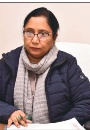
वाली पंजाब सरकार द्वारा पिछले लम्बे समय से आंगनवाड़ी वर्कर यूनियन की मांग पर विचार करते हुए इन 1240 आंगनवाड़ी वर्कर का प्रति माह मिन्नी आंगनवाड़ी सेंटरों को मेन आंगनवाड़ी सेंटरों में तबदील करने की मंजूरी जारी कर दी है। मिन्नी से मेन आंगनवाड़ी सेंटर की मंजूरी के अनुसार अब पंजाब में कुल मंजूरशुदा 27,314 आंगनवाड़ी सेंटर मेन आंगनवाड़ी सेंटरों की श्रेणी में आ गए हैं। उन्होंने कहा कि अब मिन्नी आंगनवाड़ी वर्कर का प्रति माह मानभत्ता 3500 रुपए से बढ़कर कुल 4500 रुपए हो जाएगा। उन्होंने बताया कि आंगनवाड़ी केन्द्रों में आंगनवाड़ी