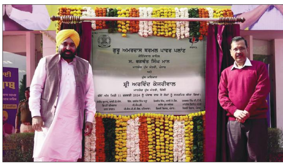
बिजली पैदावार में वृद्धि होगी। पछवाड़ा कोयला खदान का कोयला केवल सरकारी बिजली प्लांटों के लिए इस्तेमाल किया जा सकता है। इस कारण अब इस प्लांट की खरीद से यह कोयला यहाँ बिजली उत्पादन के लिए इस्तेमाल किया

की क्षमता वाले कोरबा वेस्ट, झाबुआ पावर और लैंको अमरकंटक जैसे पावर प्लांट क्रमवार 1804 करोड़ रुपए, 1910 करोड़ और 1818 करोड़ रुपए में खरीदे गए थे। पंजाब सरकार ने 540 मेगावाट की क्षमता वाला पावर प्लांट दो करोड़ रुपए प्रति मेगावाट के हिसाब से खरीदा है। यह किसी पावर प्लांट के लिए अब तक की सबसे कम कीमत है, जब कि अब तक हुई खरीदों के मुताबिक कीमत तीन करोड़ रुपए प्रति मेगावाट रही है। इस प्लांट का नाम बदल कर तीर्थे गुरु साहिब के नाम पर श्री गुरु अमरदास थर्मल पावर प्लांट रखा गया है। इस थर्मल प्लांट की क्षमता 61 प्रतिशत थी, जब कि इसमें से केवल 34 प्रतिशत तक का ही प्रयोग होता था, परन्तु अब इस प्लांट की क्षमता को 75 से 80 प्रतिशत तक किया जाएगा, जिससे राज्य में